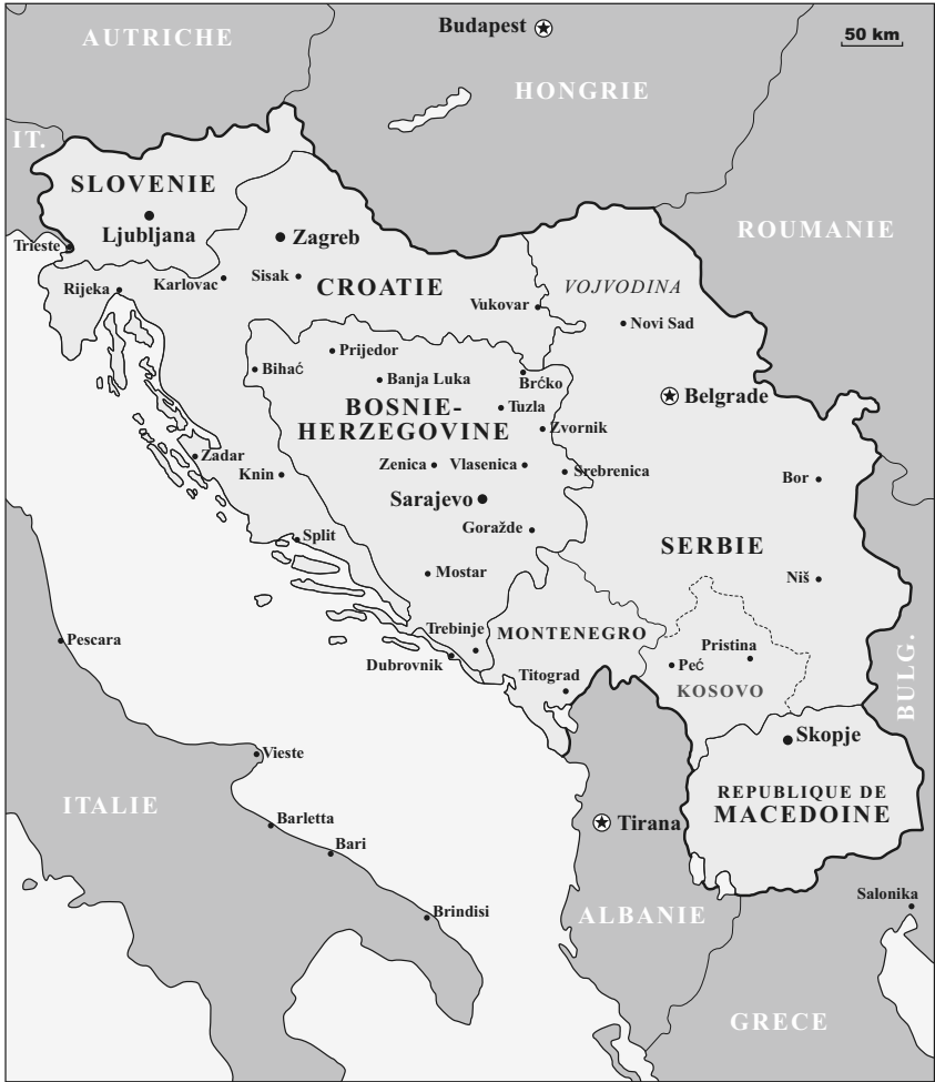
Carte 1 : La Yougoslavie de Tito