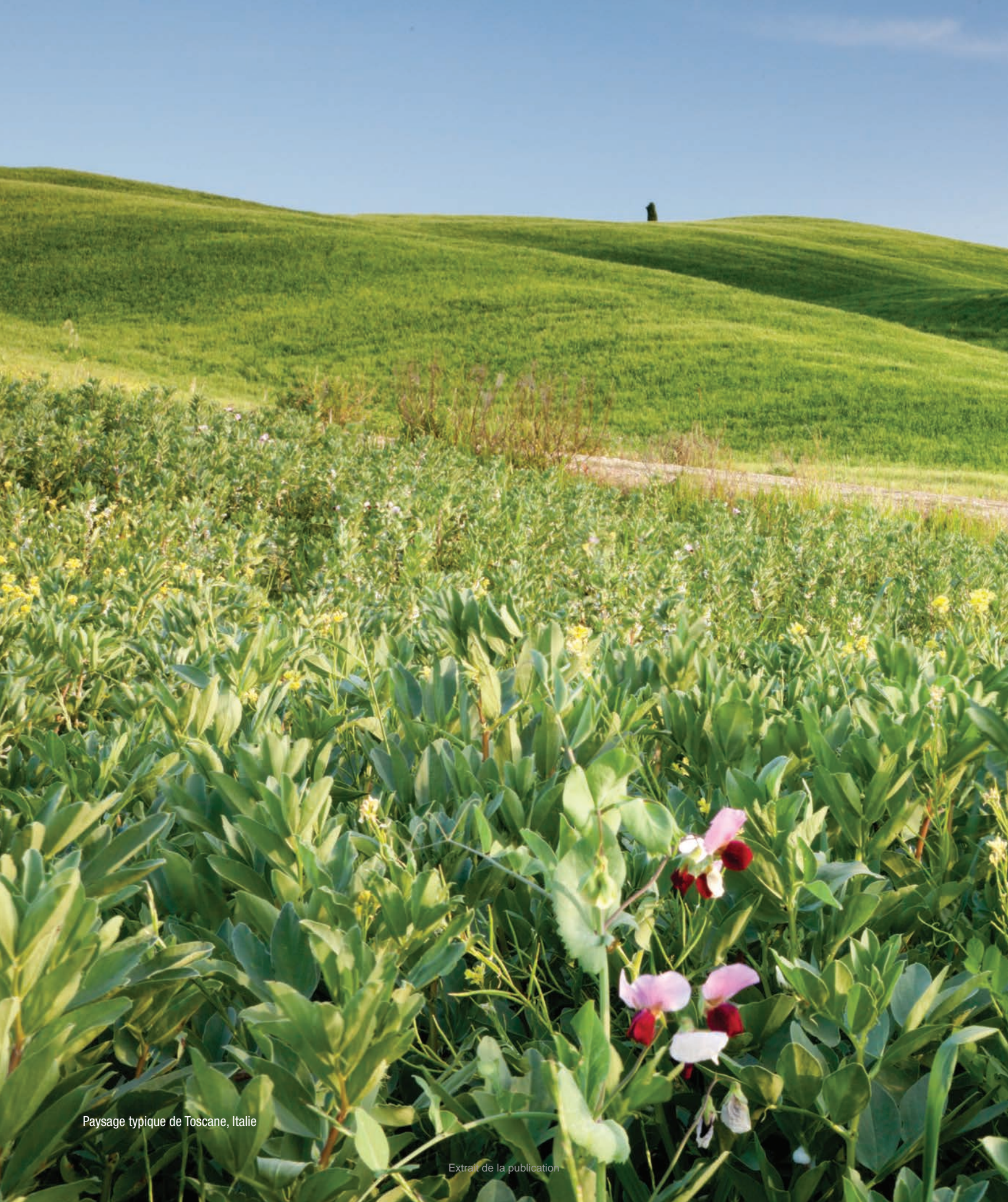
Paysage typique de Toscane, Italie