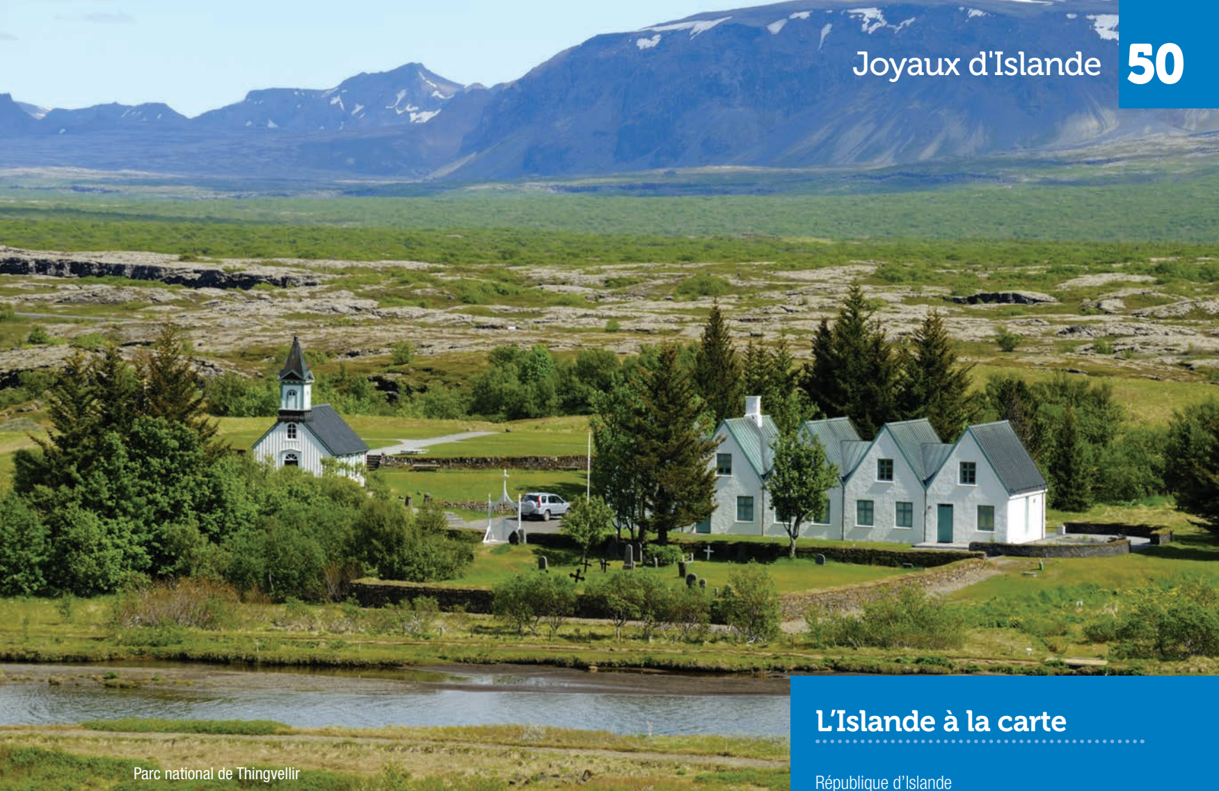
Parc national de Thingvellir