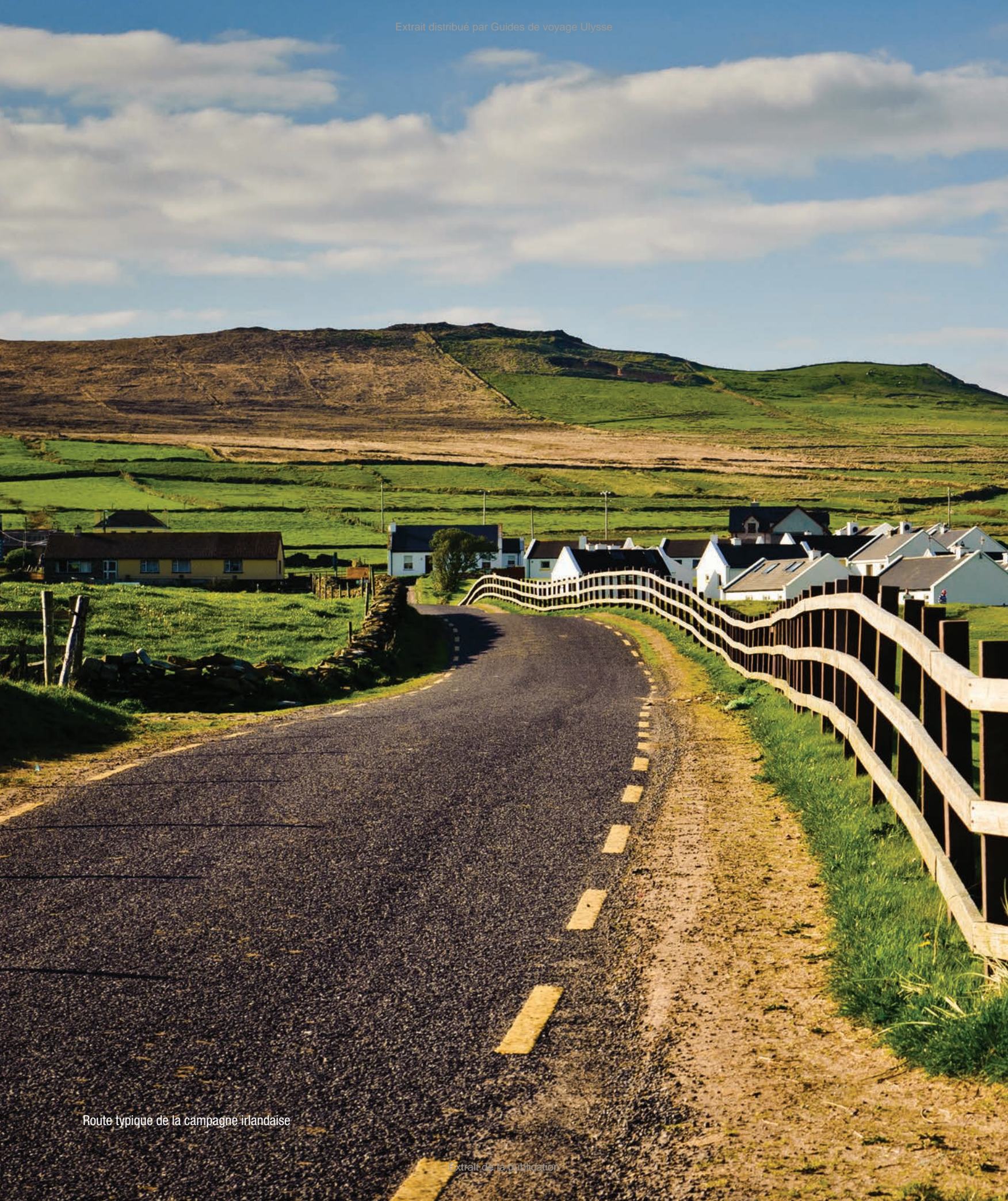
Route typique de la campagne irlandaise