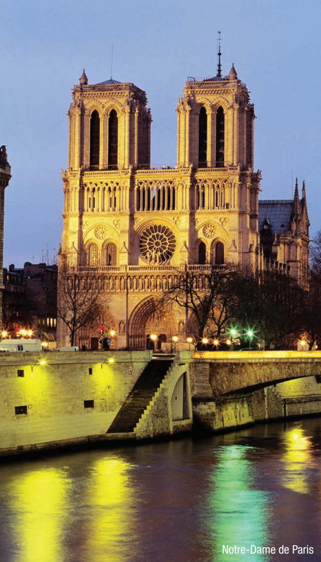
Notre-Dame de Paris