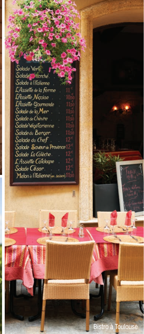
Bistro à Toulouse