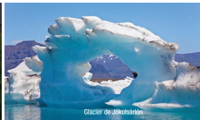
Glacier de Jökulsárlón