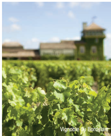
Vignoble du Bordelais