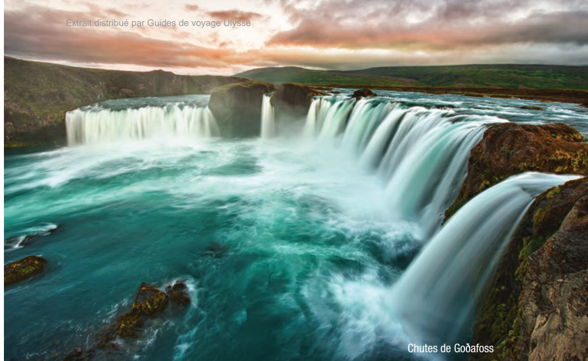
Chutes de Goðafoss